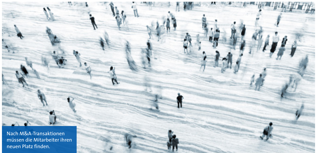
Nach M&A-Transaktionen müssen die Mitarbeiter ihren neuen Platz finden.

Wer als Verkäufer sein Unternehmen im Vorfeld eines M&A-Deals optimal aufstellt, macht es attraktiver